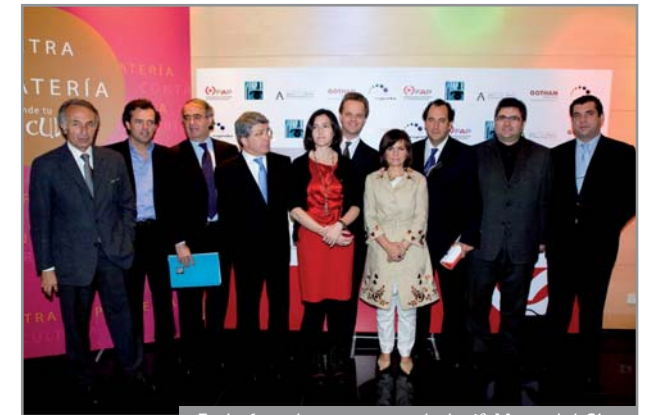
En la foto, los ponentes de la 1ª Mesa del Cine "Todos contra la Piratería", acompañados por Carmen Calvo, Ministra de Cultura.

Bajo el lema "Todos contra la Piratería" y coincidiendo con el Día Mundial de la Propiedad Intelectual, el pasado 26 de abril tuvo lugar la 1ª Mesa de Cine, donde se analizó el presente y el futuro del sector audiovisual en España, al tiempo que se reclamó al Gobierno la necesidad de crear una legislación adecuada y asimilada a la vigente en Europa y Estados Unidos, ya que nuestro país registra el mayor índice de piratería de toda Europa Occidental.